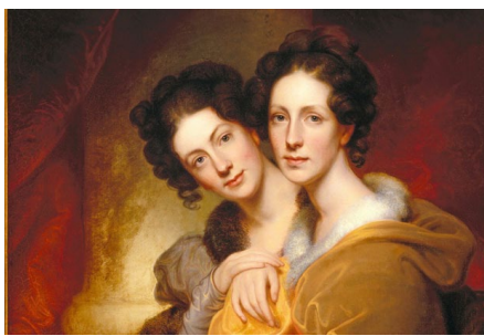
Rembrandt, “Las Hermanas”