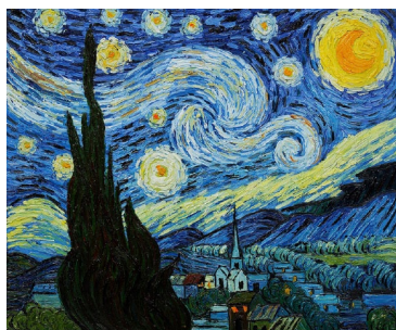
Van Gogh “Noche Estrellada”

Cuando haces buenas resoluciones de Año Nuevo, acuérdate de la historia de Noé y el Arca. Planea tus metas; escribe los pequeños pasos para lograrlas. Confía en Dios para ayudarte. Y si te sientes inundada, ¡recuerda que por lo menos no estás construyendo un arca!